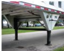
Réduction du poids avec des diabolo à montage inversé