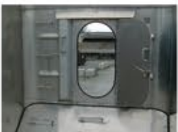
Porte piétonne MAC