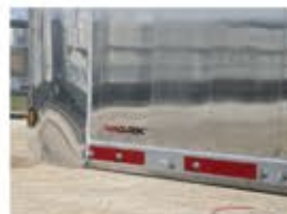
Panneau latéral lisse MVP MACLOCK