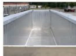
Longeron du toit cintrage bas