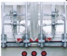
Loquets à quatre cames