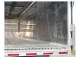
Option de doublure intégrale de la paroi