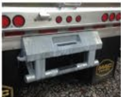
Pare-chocs poussoir arrière avec crochets de dépannage