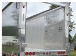
Hayon à veine d'air