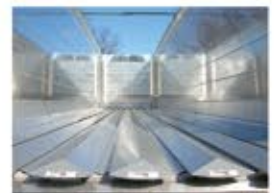
Plancher en V