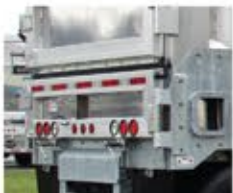
Verrou de benne à compression avec porte en deux parties