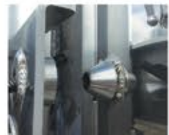
Porte dans porte - cône et bague