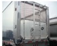
Hayon à écoulement d'air séparé - combinaison hayon plein/grillagé